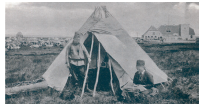
Den gamle renpark

13. Udkigstårnet og madpakkehuset ved Mindedalen: Udkigstårnet er åbent i 2014 og tilgængeligt for bevægelseshæmmede. Udkigstårnet modtog i 2014 tilgængelighedsprisen fra Handicaprådet i Viborg Kommune. Du kan også overnatte på stedet i tre shelters, som enhver må benytte og eventuelt spise i madpakkehuset. Ved starten af Mindedalen vokser et mindre antal af den fredede orkidé Plettet Gøgeurt. De må naturligvis ikke plukkes.