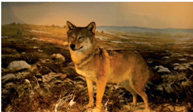
Se ulven i Naturcentrets udstilling

2. Kongenshus Naturcenter: I udstillingen kan du fordybe dig i hedens og Mindeparkens natur og historie. Her kan du blandt andet se mere om de sidste ufrugle i Danmark samt se film og billeder om livet på heden.