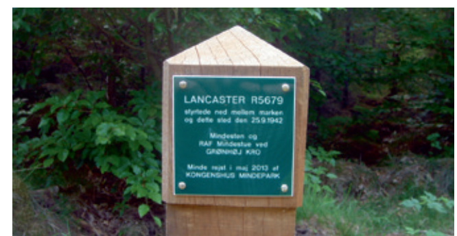
Pælen med mindetavlen for Lancaster flystørtet